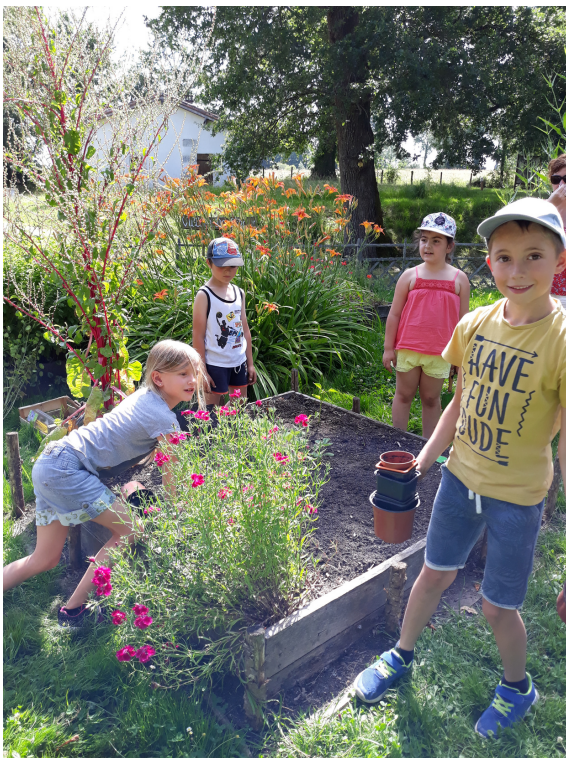
Élèves de l'école de Ménesplet - été 2019